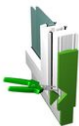
Bild 1: Abdichtung aussparen

Pulverbeschichtungs- und Lackierprozesse: SP351 kann nach dem vollständigen Aushärten kurzfristig erhöhten Temperaturen ausgesetzt werden und eignet sich somit zum Pulverbeschichten. Nachfolgende Einbrennprozesse sind ohne Veränderung der mechanischen Eigenschaften des Klebers möglich: +180°C über einen Zeitraum von max. 30 Minuten, +200°C über einen Zeitraum von max. 10 Minuten.